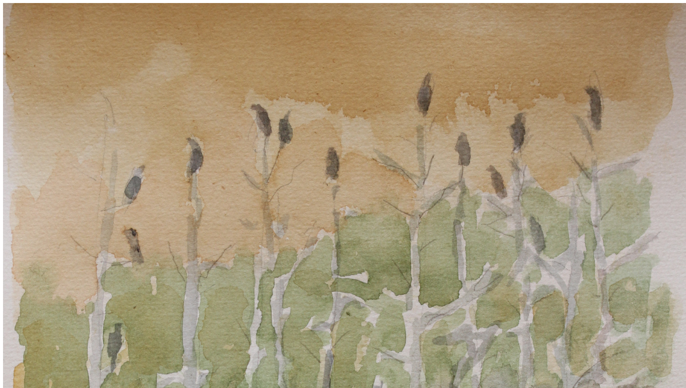
7.3. Bregnemosenes beboere – skarven – har i årenes løb været hårde ved grannerne.

Langs banelinjen løber en asfalteret cykel/gangsti. Her drejer du til venstre. Det er ikke sikkert, at du bemærker det, men mellem syren og roser vokser et stort hasselnøddekrat. Det er ikke nu, du skal være der. Det er senere på året, men prøv at holde øje med nødderne. I eftersommeren kan du hurtigt få plukket dig en god håndfuld hasselnødder her.