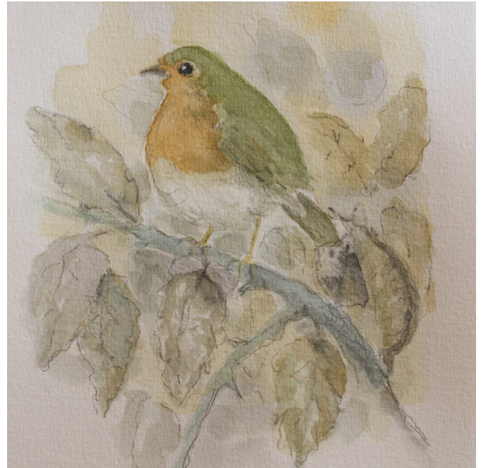
7.1. Den unge skov med små tæer og krat giver mulighed for mange småfugle. Her er rødhalsen. Især forår og efterår er der gode chancer fuglen.

Undervejs, især i den lidt fugtige del af skoven, kan du komme til at følges med den brune tudse. Stor, til tider oppustet og lidt kluntet vralter den af sted i et adstadigt tempo.