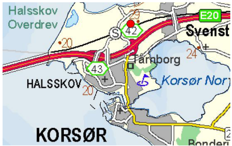
Oversigtskort. Den store røde prik viser turens udgangspunkt.