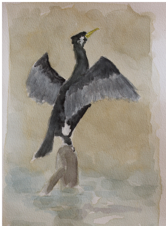
7.4. Skarven har med udbredte vinger "hængt sig til tørre". Er det et signal til artsfællerom, at der er godt af fiske her?

Grøftekanterne er i maj, og indtil de bliver slået i juni, et mylder af forskellige planter, der holder af den magre jord i rabatten. Lidt trist at kommunens folk stadig finder anledning til at slå væksterne,