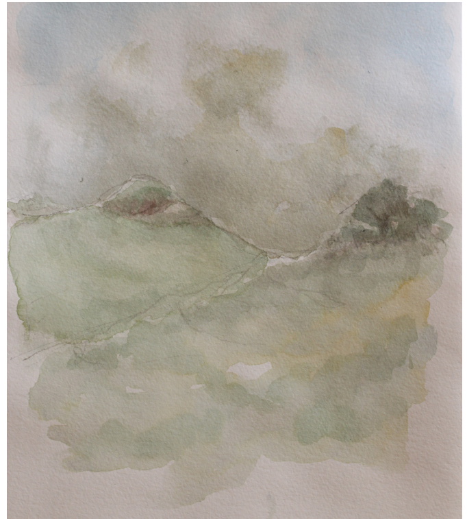
7.2. Ude af Højbjergskoven - på vej mod hundeskoven ligger åbne arealer. På din venstre side er der kig til Højbjerget. På toppen ligger en næsten skjult gravhøj.